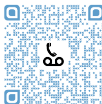
Document ressource N°1