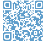
Document ressource N°2

A l'aide du document ressource N°2, répondez aux questions ci-dessous.